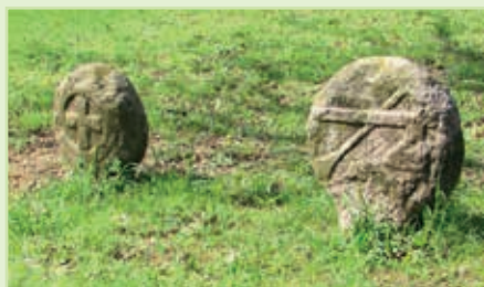
Kamenné památky ve Vítkově – tzv. celní kola.

Celkem bylo na dole Vítkov II dobývacími pracemi vylomeno 1 860 154 m 3 horniny, 3 205 100 tun rudniny a získáno 3 973 tun kovu. Konečná hloubka jámy byla 950,9 m a bylo z ní rozfáráno 16 pater. Důl zaměstnával cca 330–475 lidí. Poslední symbolický vůz na dole Vítkov II byl vytěžen 19. 12. 1990 a počátkem ledna 1991 se důl začal likvidovat a zatápět. I v současnosti je lokalita spojena s hospodářskou činností. Veřejně rejstříky uvádějí ve Vítkově sídlo 21 firem. K nejznámějším jistě patří Novasport, KDK, LEKI, SHADOWS.