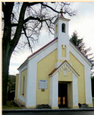
Kaple sv. Jana a Pavla v Oldřichově.

Přední strana obálky: autor fotografie: Ivana Štroblová