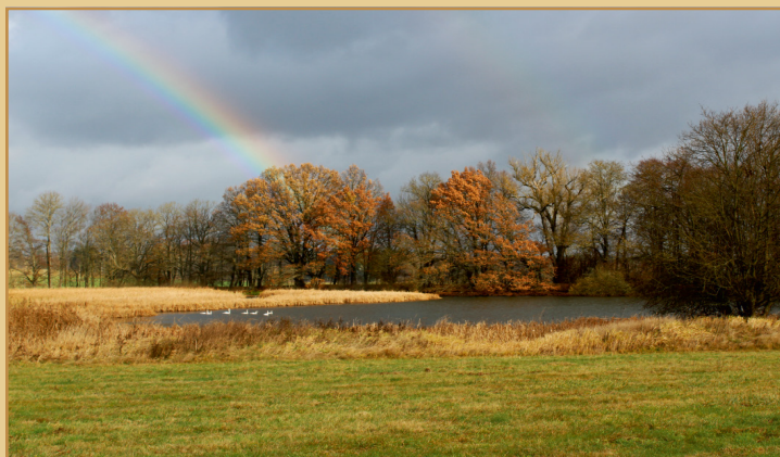
Šmatlavý rybník nedaleko Vilémova.

PhDr. Jana Hutníková ředitelka Muzea Českého lesa