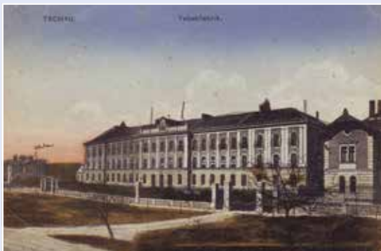
Tabáková továrna v Tachově na pohlednici z roku 1919.

Dnes si připomeneme státní podnikání v dobách c. k. monarchie. Tabák byl totiž tehdy zpracováván státním monopolem. Aby se zmírnila nouze v pohraničních oblastech, povolil v únoru 1897 císařský verdikt zřízení dvou tabákových továren v Čechách. O jednu se ucházela města Planá, Stříbro a Tachov. I zásluhou tehdejšího starosty a poslance říšského sněmu H. Swobody a hraběte Windischgrätze, prezidenta rakouské panské sněmovny, bylo rozhodnuto ve prospěch Tachova.