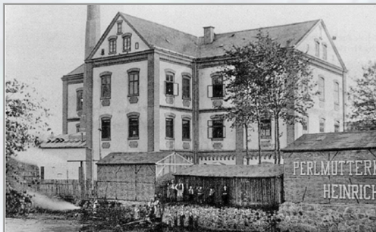
Továrna Heinricha Adlera v Tachově.