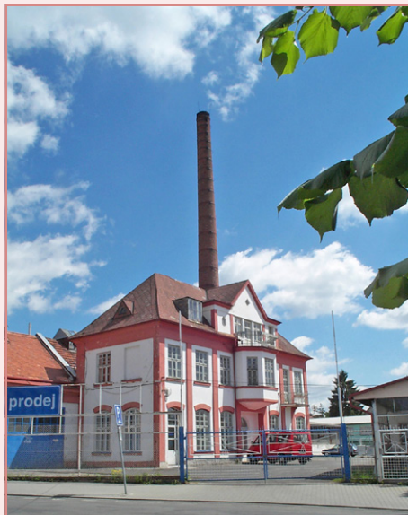
Fotografie zbourané továrny z roku 2000.