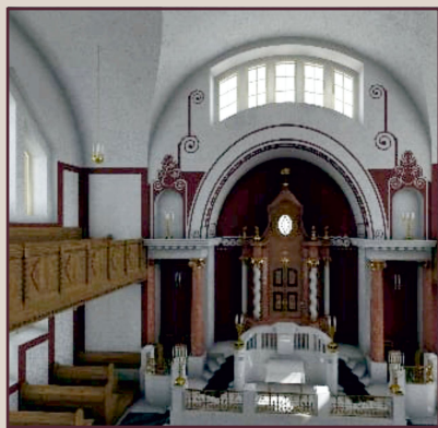
Vizualizace interiéru tachovské synagogy z infopointu expozice muzea.