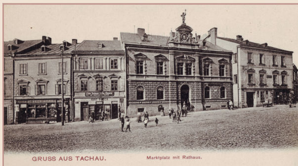
Na pohlednici tachovského náměstí vlevo obchod Heinricha Adlera.

Příště se zaměříme na rodinu bratrance Heinricha Adlera Josefa a vzdálené příbuzné, rodinu Ignaze Adlera.