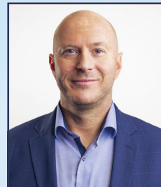
Mgr. Petr Vrána starosta města Tachova

Závěrem mi dovoluji ještě jednou poděkovat za důvěru a podporu jménem nově zvoleného vedení města a popřát vám klidné prožití nadcházejících svátků.