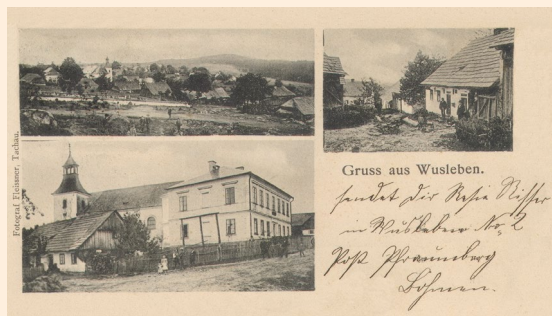
Pohlednice obce Bohuslav z roku 1904.