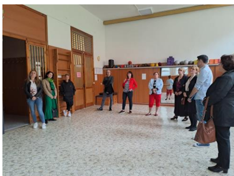
Pracovní skupina pro matematickou gramotnost na návštěvě v DDM Tachov