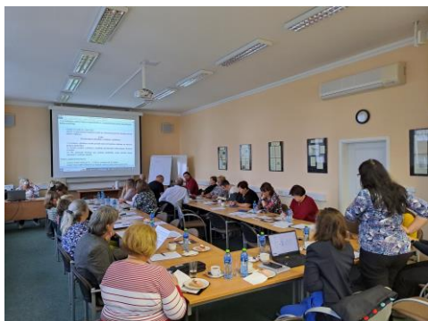
Setkání ředitelů škol