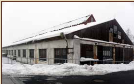
Bývalá pila u Plánské ulice.

20. března – Před sto lety ani parní pila u Plánské ul. (poz.: dnes Sokolovské ul.), ještě nestála a nyní Grenzbote teprve informoval o tom, že nad nádražím proběhne vyměřování této novostavby rakouskou Lesní a dřevařskou akciovou společností ve Vídni (na tomto počínu se domluvila s knížetem, který jí pronajal tento pozemek).