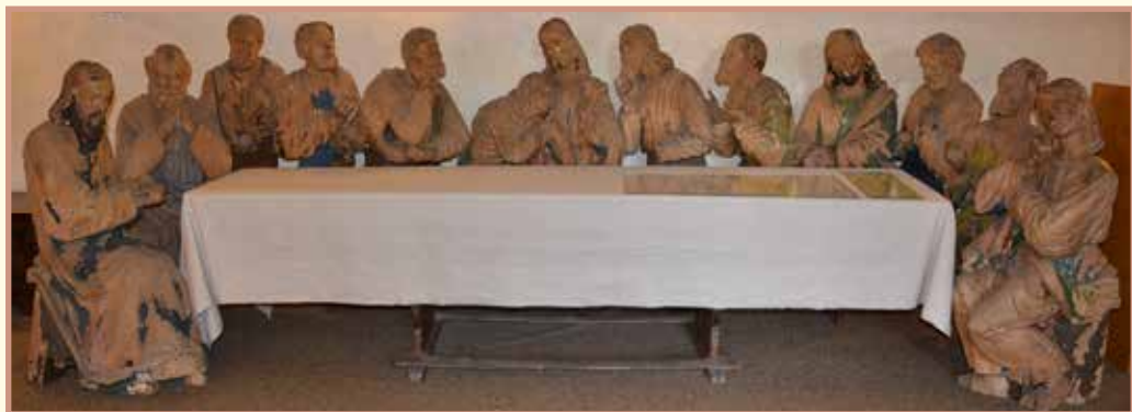
Sousoší Poslední večeře Páně od Johanna Rumplera je vystaveno v bývalém františkánském klášterním refektáři, dnes muzeem Českého lesa v Tachově.