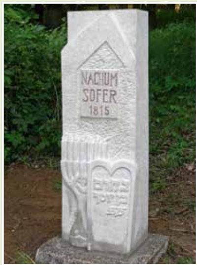
Milník času věnovaný záračnému rabínovi Nachumu Soferovi stojí při severním okraji starého židovského hřbitova.

1837 ve věku 33 let a jím rod vymřel po meči. Nachum Sofer zemřel 10. 5. 1815. Bylo mu minimálně 70 let, maximálně pak 85 let. Sepsal poslední vůli, která je dnes uložena ve sbírce rukopisů Židovského muzea v Praze. V ní popisuje, jak s ním má být jako s člověkem chybujícím zacházeno po smrti a před pohřbem, aby byl očištěn od hříchů. Dále v řadě odkazů projevuje silné sociální citění. V poslední vůli navrhl také text vlastního náhrobku, který byl posléze vyryt do měděné tabulky a na náhrobku skutečně umístěn. Jeho hrob se stal poutním místem až v období 1. sv. války, kdy zde pobývali židovští uprchlíci z Haliče, kteří si pomocí číselné kombinace hebrejských písmen vyložili text jako prorockou předpověď Velké války. Náhrobek zmizel při první fázi ničení tachovského židovského hřbitova v 70. letech 20. století. Tehdy tzv. rabínská řada byla zničena z důvodu rozšíření silnice. Při příležitosti 200. výročí úmrtí došlo k vytvoření repliky náhrobku na původním místě a opět k němu, jako v minulosti, míří řada poutníků z celého světa, aby tu prosili o uzdravení, početí či ochranu před zlými sousedy. (více: D. Polakovič: Poslední vůle tachovského cadika. Sborník Muzea Českého lesa v Tachově 34/2015)